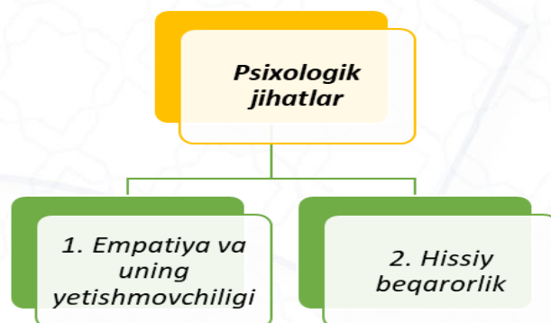
2-rasm. Jinoyat olamiga xos psixologik jihatlar

3. Psixologik jihatlar . Ma'lumki, jinoyatchilarning hissiy idrok va ifodasi alohida e'tibor talab qiladi: