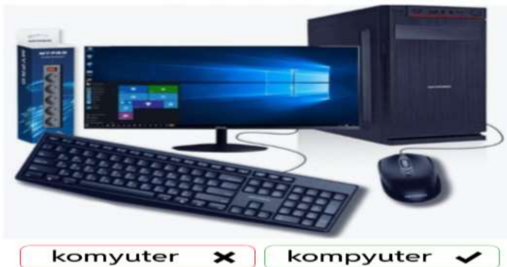
4-rasm. “Vizual imlo mashqi”.