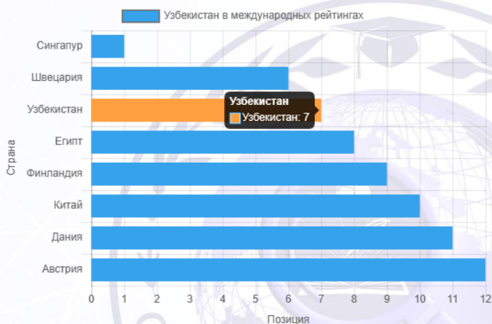
Рис.4. Индекс закона и порядка

Эти платежи также способствуют к увеличению совокупной нагрузки на бизнес. В целом, налоговая нагрузка на бизнес в РУз имеет тенденцию к снижению. Однако она все еще остается достаточно высокой по этой причине для дальнейшего улучшения бизнес-климата в РУз необходимо продолжать работу по снижению налоговой нагрузки и других обязательных платежей.