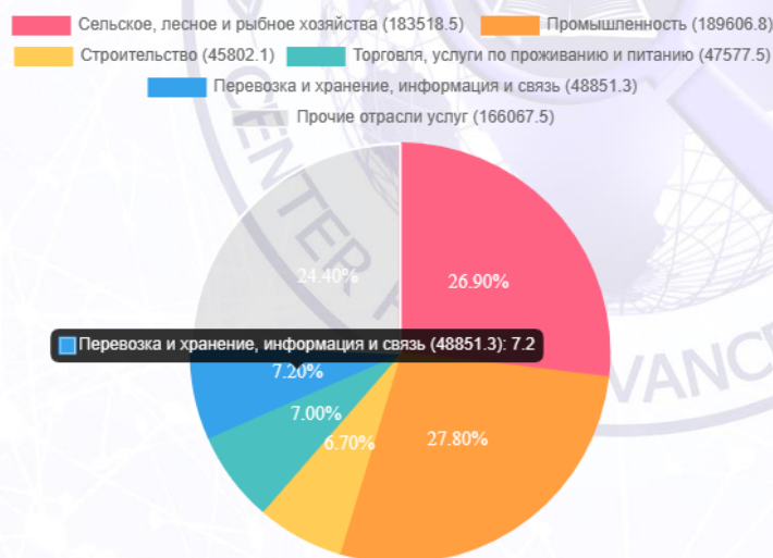
Рис. 2. Доля ВВП по отраслям 2021

Проведение комплексного анализа позволит сделать более обоснованное решение о целесообразности инвестирования в РУз