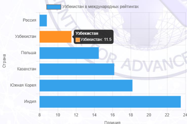
Рис.3. Налоговая нагрузка на бизнес

При реализации этих мер Узбекистан может стать одной из самых динамично развивающихся стран в Евразии.