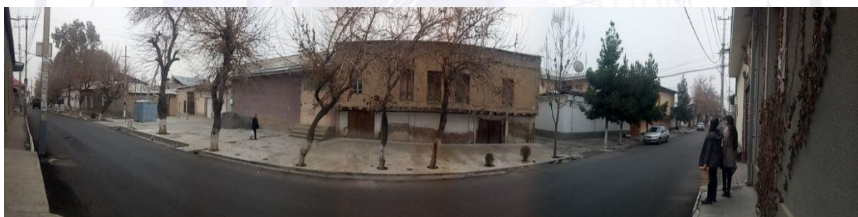
7-rasm. Samarqand. So'zangaron ko'chasi