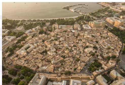
5-rasm.Yaponiya. Kayabuki no Sato