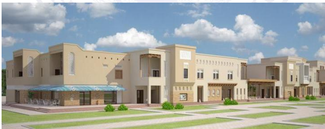
8-rasm. Samarqand ko'chalari