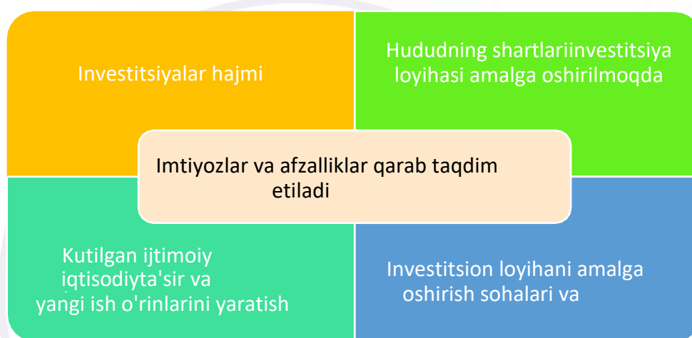
6-rasm. Mezonlarga muvofiq taqdim etilgan imtiyozlar va afzalliklar 8

Qonun “Xorijiy investitsiyalar to‘g‘risida”, “Investitsiya faoliyati to‘g‘risida”gi va “Chet ellik investorlar huquqlarining kafolatlari va himoya qilish chora-tadbirlari to‘g‘risida”gi qonunlarning qonun kuchga kirganidan keyin o‘z kuchini yo‘qotgan asosiy qoidalarini o‘zida mujassam etgan yagona hujjat bo‘lib xizmat qiladi. kuch.